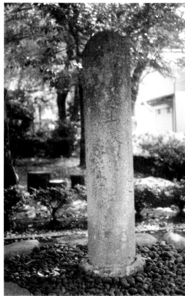
図4. 岩淵の虫塚(右は碑文)

當年七月中旬頃ヨリ俄ニ稻株ヨリコヌカ虫多生シ 悉稻ヲ枯シ一統ナンキニ及布木綿ノフクロヲ以テトリ 集メ候虫此所ニ拾六俵埋ヲク若此末虫生ル時ハ草修理ノ 頃早ク木ノ實油ヲ用ユレハ愁ウスカルヘシ余ハ除蝗録 ニ委シ虫ノ愁ヲオソレ後年ノ記録ニ建之畢 天保十年九月建之